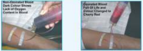
ಓರ್ಯೋನ್ ರಕ್ತ ರಕ್ತ ಓರ್ಯೋನ್‌ಯುಕ್ತ ರಕ್ತ ರಕ್ತ