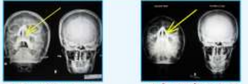
ಎಕ್ಸ್-ರೇ ಟ್ರಾನ್ಸಮಿಟಿಂಗ್ ಮೊದಲು ಎಕ್ಸ್-ರೇ ಟ್ರಾನ್ಸಮಿಟಿಂಗ್ ನಂತರ