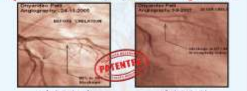
ಕಿಲೇಜನ್ ಮುಂಟೆ ನೋಟ, ಮುಖ್ಯ 28 ಮಿ.ಮೀ ಕ್ರಿಯಾ ಕೋಶ 70% [LVEF] ಕಿಲೇಜನ್ ನಂತರ ನೋಟ, ಮುಖ್ಯ 28 ಮಿ.ಮೀ ಕ್ರಿಯಾ ಕೋಶ 70% [LVEF]