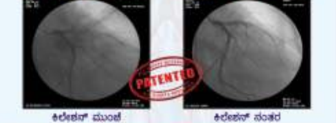
ಕಿಲೇಜನ್ ಮುಂಟೆ ಕಿಲೇಜನ್ ನಂತರ